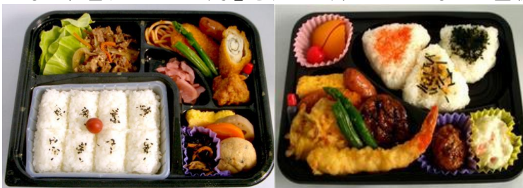
【日替わり弁当（お茶付き）】