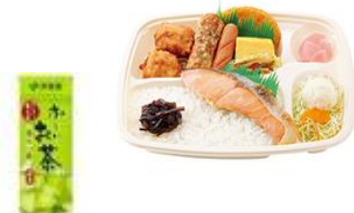
【ほっかほっか亭（お茶なし）】