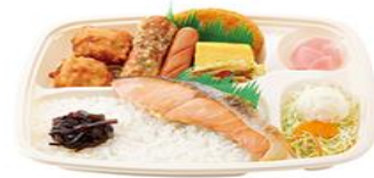
【ほっかほっか亭（お茶なし）】

※上記の様なお弁当を予定しております。 ※仕入れ状況やお申込状況により、変更になる場合も御座います。