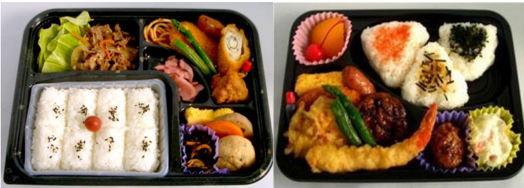
【日替わり弁当（お茶付き）】

※体育館に11時のお時間にお届け予定です。 ※お申し込み頂いたお弁当のゴミは、夕方に回収致します。（予定） 指定の場所に15時までにお持ち下さい。 なお、各チームで用意されたお弁当のゴミなどは回収致しかねます。